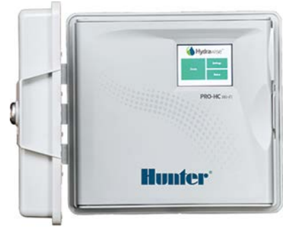
Pro-HC (Innensteuergerät aus Kunststoff) Höhe: 21 cm Breite: 24 cm Tiefe: 8,8 cm

Testen Sie die Hydrawise-Software direkt, auch ohne Steuergerät unter hydrawise.com