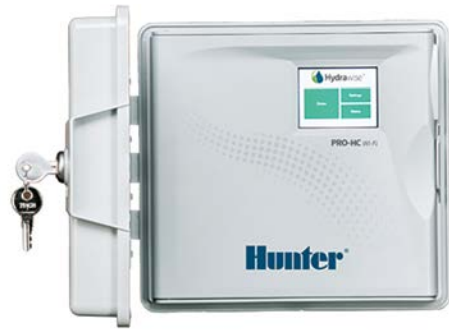
Pro-HC (Außensteuergerät aus Kunststoff) Höhe: 22,8 cm Breite: 25 cm Tiefe: 10 cm